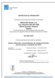
ISO 9001:2015 Sistema de gestión de la calidad