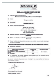
UNE-EN 14428:2016 Mamparas de baño