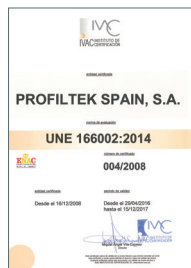
UNE 166002:2014 Gestión de I+D+i